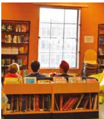
Läsprojekt – Läsande åttor, sid 11