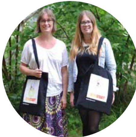
En dag med Bokstart, sid 9