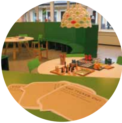
Barn och unga på fritiden i biblioteket, sid 4