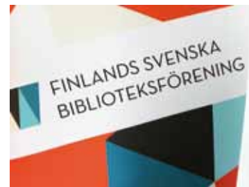
Finlands svenska biblioteks dagar, sid 18