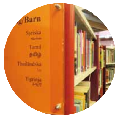
Biblioteksrummets läsbarhet, sid 13