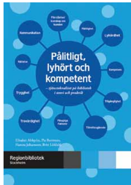
Omslag: Amanda Bigrell

Regionbibliotek Stockholms senaste skrift Pålitligt, lyhört och kompetent – tjänstekvalitet på bibliotek i teori och praktik är på väg ut till läsarna.