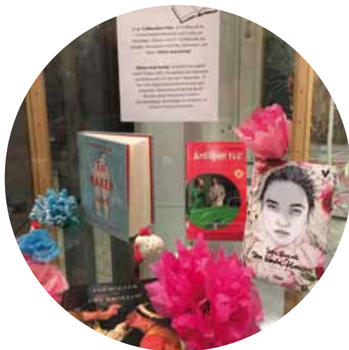
Möten med läsning i Täby, sid 12