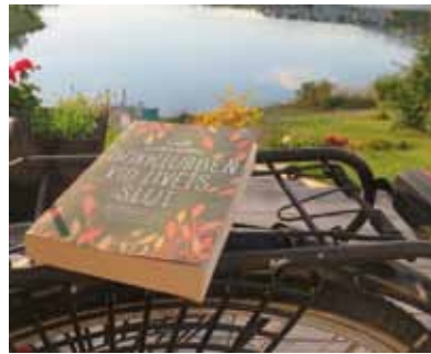
Vad läsning gör—om läsfrämjande och biblioterapi, sid 5