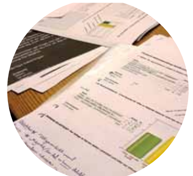
Självskattning av boksamtal, sid 10

Tidningen Länsnytt ges ut av Regionbibliotek Stockholm och utkommer med fyra nummer per år.