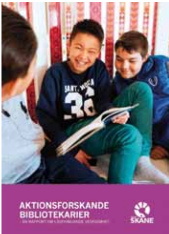
Forskning lyfter läsfrämjande projekt på bibliotek, sid 8