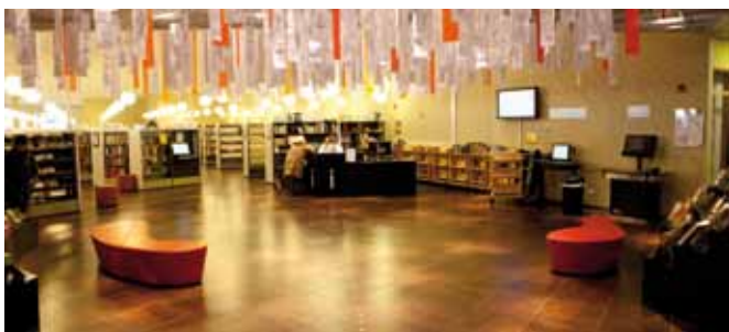
Lyssna på en novell på Österåkers bibliotek, sid 17