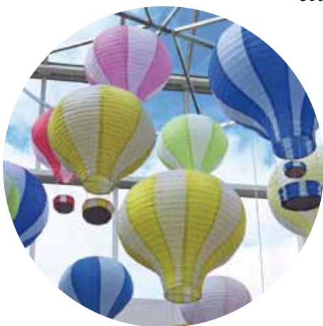
BiblioteksBerättarna, sid 14