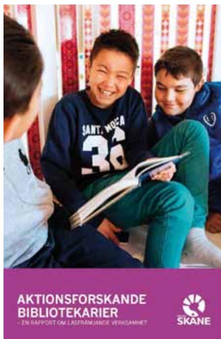
Omslag: Kreation

För drygt ett år sedan fick en grupp bibliotekarier i Skåne och Halland chansen att fördjupa sin läsfrämjande praktik på biblioteket med hjälp av aktuell forskning, i så kallade forskningscirklar. Nu berättar de om sina spännande erfarenheter i boken Aktionsforskande bibliotekarier – en rapport om läsfrämjande verksamhet från Kultur Skåne , som presenterades på Bokmässan i Göteborg.