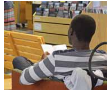
En krönika om läsning, sid 7