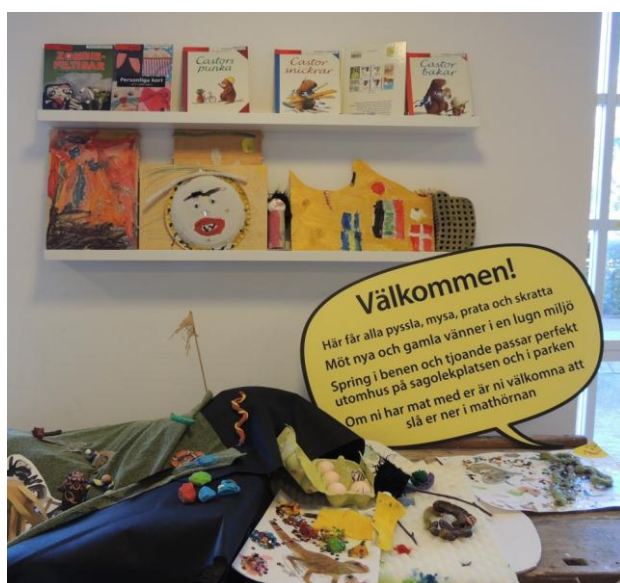
Verkstaden på småbarnsavdelningen, Malmö stadsbibliotek

På Malmö stadsbibliotek finns även flera verkstäder och det är en verksamhet som beskrivs i ”Modelprogram för folkebibliotek” och som blir allt vanligare på bibliotek: I avsnittet om verkstäder står det " Stadig flere biblioteker danner ramme om brugernes egne aktive kulturproduktion: Tegneserietegning, forfatterskole, 'spoken word', 'hacker labs' " Via webbsidan ges tips, idéer och råd till bibliotek som har eller på gång att starta verkstäder på sina bibliotek.