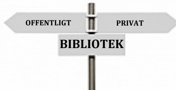
Figur 2. Biblioteket mellan det offentliga och privata