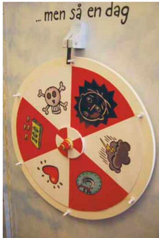
Detalj från Berättarskåpet