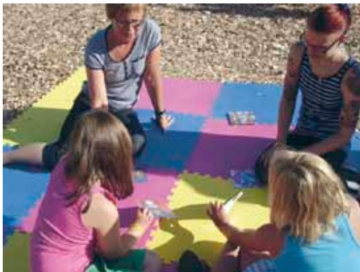
Bildberättande på O-ringen i Örebro

BUBBLAN ERBJÖD OLIKA berättarstationer med bland annat bildberättande, stafettmålning, magnetpoesi, göra animerad film, bokdans, högläsning. Att bara hänga vid Bubblan och snacka, eller spela spel