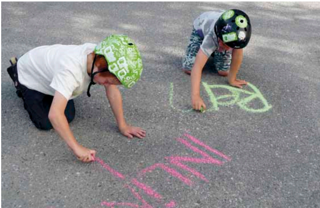
Asfaltberättande vid skatehallen i Eskilstuna