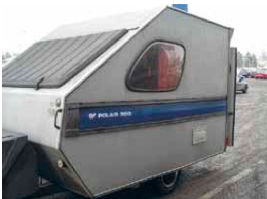
Bubblan före motivlackering...

Barnens perspektiv på vad ett rullande berättarhus skulle kunna vara undersökte vi genom att intervjua flera barn. De tryckte på att ”vagnen” måste se häftig ut, kanske grafittimålad? Det ska finnas många saker att prova på och göra men man ska också kunna bara hänga. Kanske kunde man låna ut simglasögon när den var på stranden? Och det vore coolt om man kunde laga mat i den.