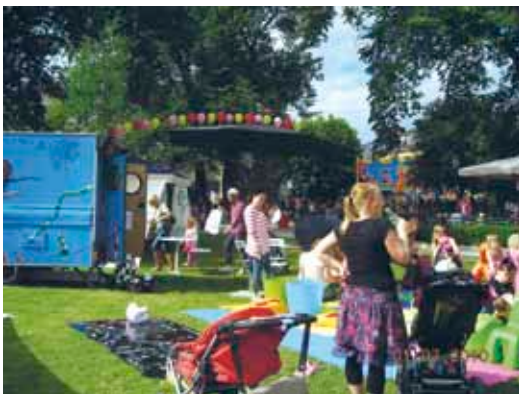
Bubblan på cityfestivalen i Västerås

Under första sommaren tog de tre konsulenterna ansvar för logistik och annat praktiskt. Det var ont om tid och vi ville absolut komma ut till barn och ungdomar och skaffa oss erfarenheter och se om