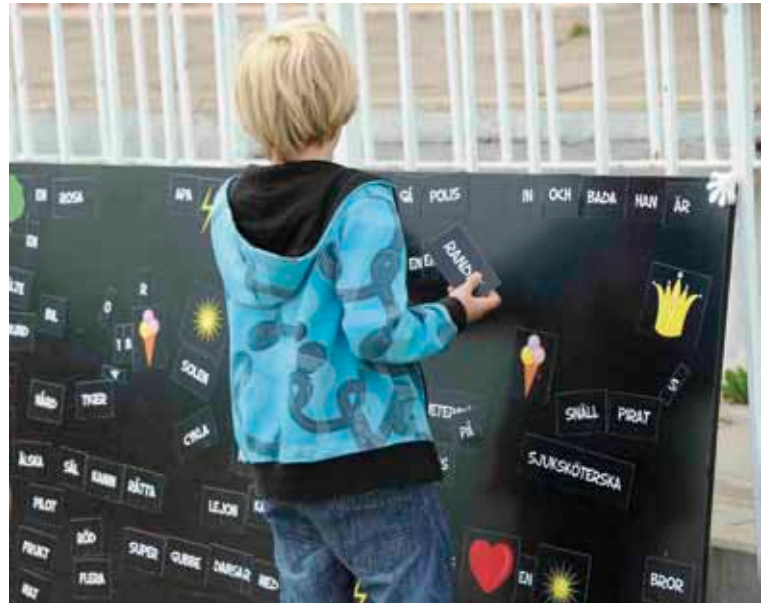
Magnetberättartavlan som specialtillverkats för Bubblan

det skulle fungera. Vi erbjöd då endast de tre stora kommunerna att få arbeta med Bubblan, tiden räckte helt enkelt inte till att på ett bra sätt involvera alla kommunerna i våra tre län just då.