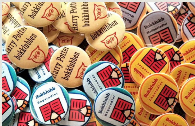
På Lidingö har alla bokklubbar sin egen pin.