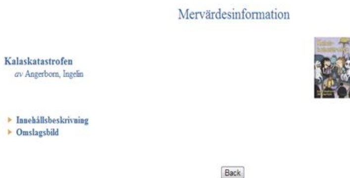
Bild 2: Ett resultat av hur bilder hanteras i katalogen är att bilder ofta visas i mycket små format, och ibland först efter att användaren har upptäckt rubriken "mervärdesinformation".