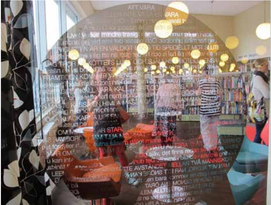
Österåkers bibliotek